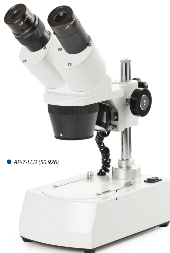
● AP-7-LED (50.926)